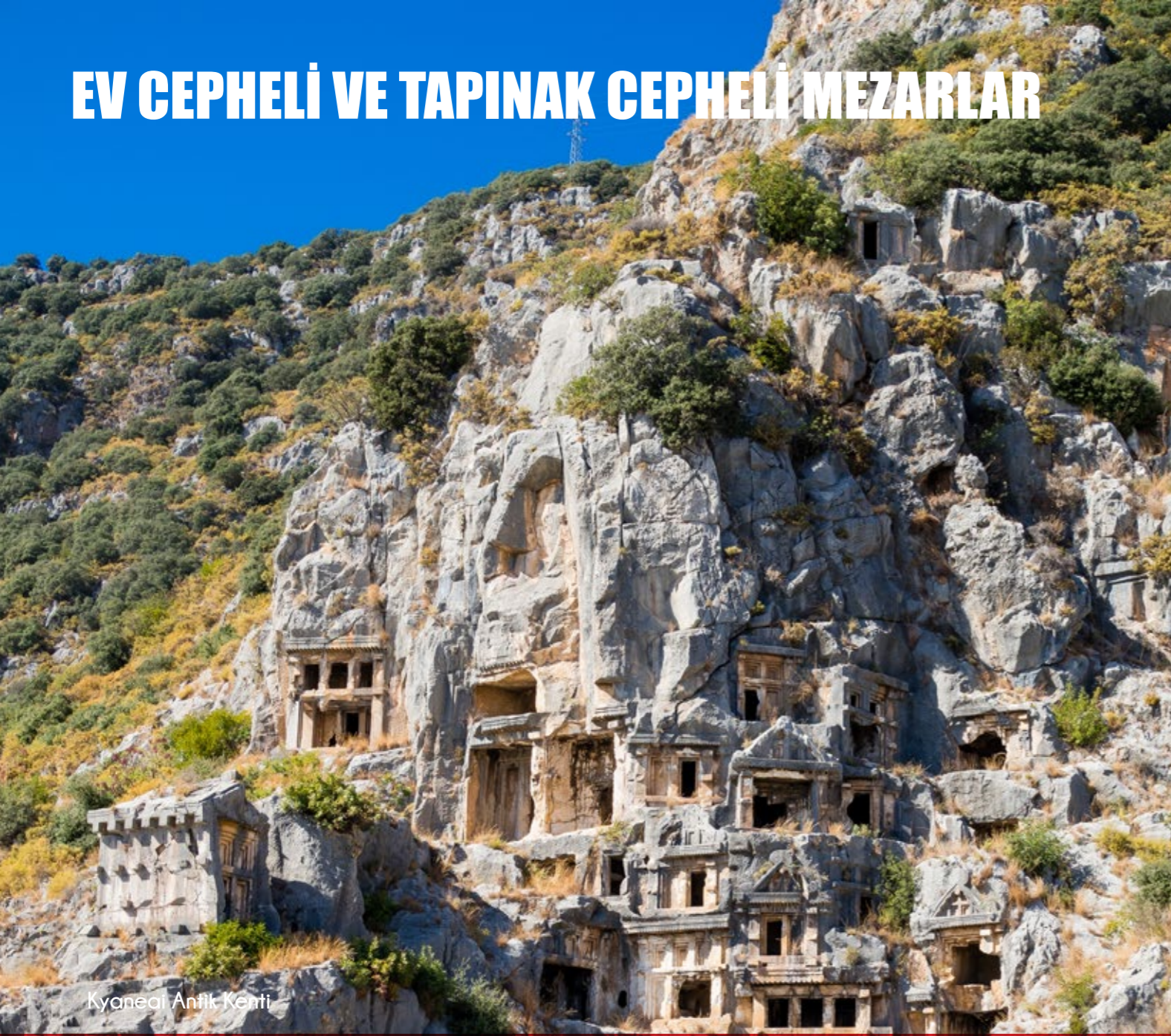
Kyaneai Antik Kenti

Ev tipi mezarlar, bir, iki nadiren üç katlı olup ahşap ev yapılarının taklitleri olarak ortaya çıkarlar. Kare şeklinde hatıl uçlarının tıpkı ikamet yapılarında olduğu gibi dışarıya doğru çıkık oldukları görülür. Giriş kapılarının üzerinde bir sıra yuvarlak ya da kare hatıl ucu görülür.