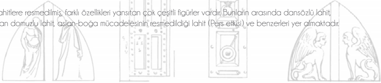
ŞİŞİRİN ANTIK KENTİ, SEMERDAM TİPİ, İDİL, BENNDORF, NIEMANN, 1904

Bu lahitlere resmedilmiş, farklı özellikleri yansıtan çok çeşitli figürler vardır. Bunların arasında dansözlü lahit, yaban domuzlu lahit, aslan-boğa mücadelesinin resmedildiği lahit (Pers etkisi) ve benzerleri yer almaktadır.