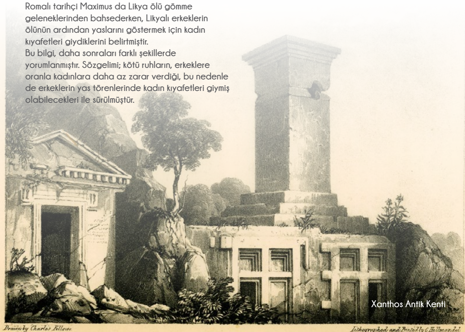
Xanthos Antik Kenti

Romalı tarihçi Maximus da Likya ölü gömme geleneklerinden bahsederken, Likyalı erkeklerin ölünün ardından yaslarını göstermek için kadın kıyafetleri giydiklerini belirtmiştir. Bu bilgi, daha sonraları farklı şekillerde yorumlanmıştır. Sözelgemi; kötü ruhların, erkeklere oranla kadınlara daha az zarar verdiği, bu nedenle de erkeklerin yas törenlerinde kadın kıyafetleri giymiş olabilecekleri ile sürülmüştür.